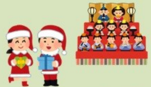
季節イベントの上映会