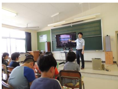
【小学校情報モラル出前授業】