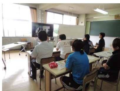
【中学校情報モラル研修】