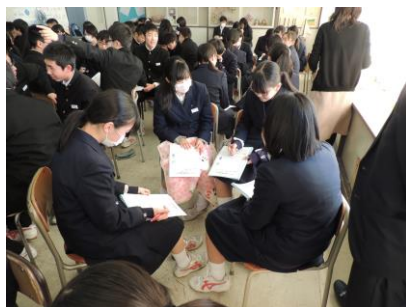
【中学校情報モラル出前授業】